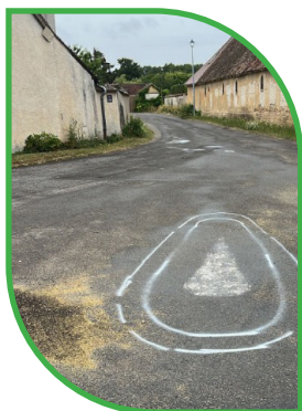
Fontaine, carrefour rue de la libération et rue des châtaigniers