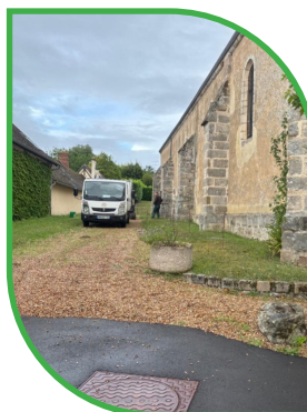
Ouerre, accès PMR église